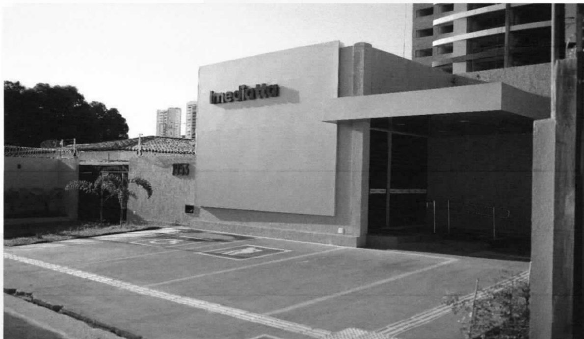
FOTO INTERNAS E EXTERNAS

ENDEREÇO: Rua Acácia, 1953, Bairro Jôquei CIDADE/ESTADO: Teresina – PI CEP: 64.049-170 PONTO DE REFERÊNCIA: atrás da Loja ZL1 Multimarcas (Av. Homero Castelo Branco) TELEFONE: (86) 3029-1881 // 9 98116886 EMAIL: licitacao@imediatta.com